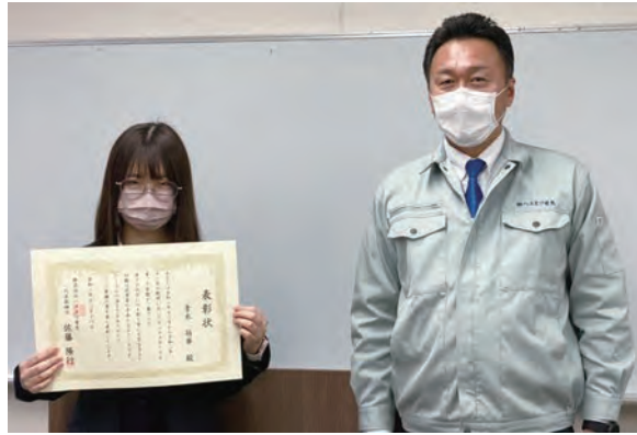
← ↑ 各種表彰制度があります