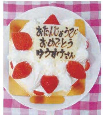
お誕生日ケーキのプレゼント♪