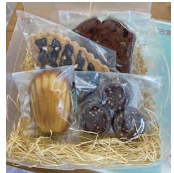
バレンタインのプレゼント♪